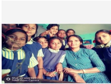
जिल्हा परिषद मराठी मुलींची शाळा पहरपेठ

त्यावेळी वाटले की ,माझ्या या गुणी मुलींना उचलून घ्यावे आणि उंच हवेत अलगद झेलावे. त्यांची तक्रारीतही समाधान आणि मुलीबद्दल अभिमान आणि माझ्या बद्दल आदर असा त्रिवेणी संगम होता जणू!